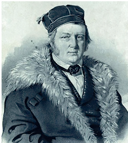
Рис. 1. Академик Василий Яковлевич (Фридрих Георг Вильгельм) Струве (1793–1864) 1